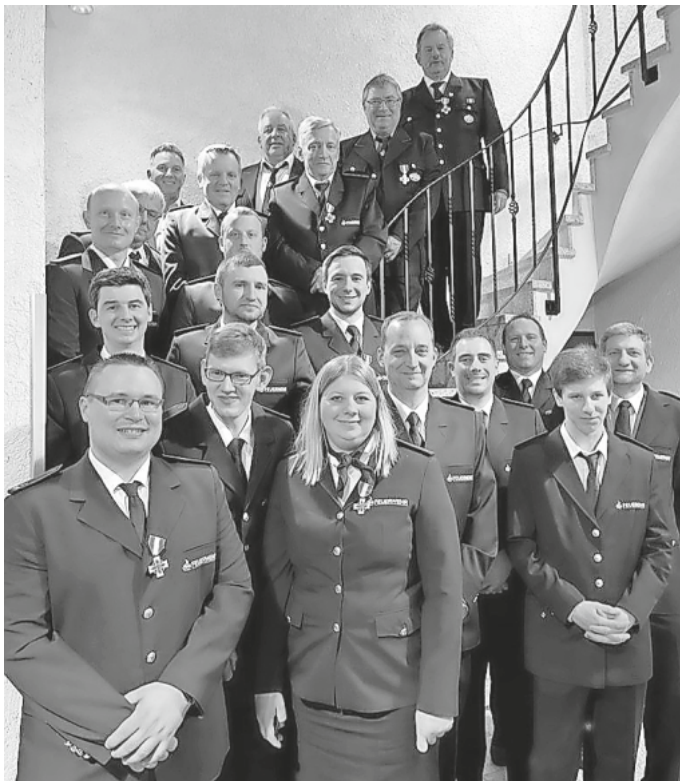
Bei der Jahreshauptversammlung der Feuerwehr Ballrechten-Dottingen gab es zahlreiche Beförderungen und Ehrungen.

„Ihr macht durch euren Dienst die Selbstverständlichkeit in den Köpfen der Bürger!“ Diesen Satz gab Kommandant Markus Karrer allen Aktiven mit auf den Weg und beendete eine gelungene Versammlung.