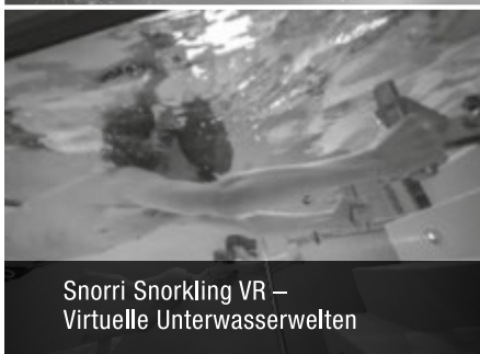
Snorri Snorkling VR – Virtuelle Unterwasserwelten