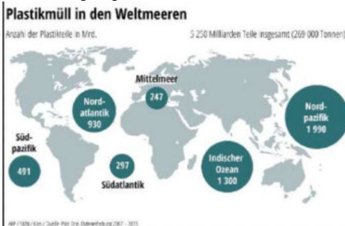
Plastikinseln aus Süddeutsche Zeitung

Land wird abgetragen und seine Sedimente werden ins Meer verfrachtet. Und damit unser Müll.