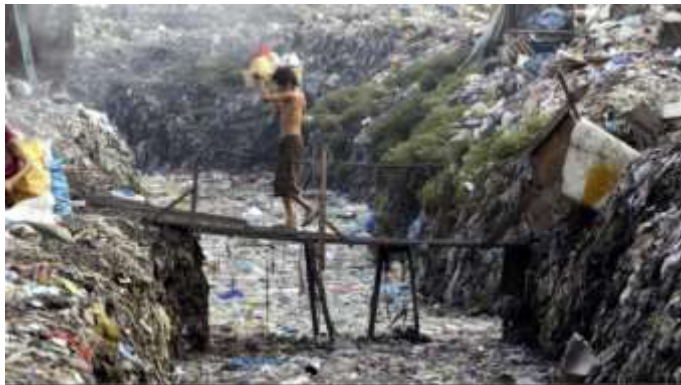
Kleiner Mensch und Müllberge in Asien. Europas Export (N24)