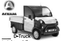
D-Truck Leichtmobile Tullastraße 6 79341 Kenzingen