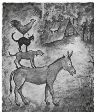
Regie: Willi Sander

Theatergruppe Jung+Alt der Ev. Kirchengemeinde 1. Aufführung: Samstag, 7. September 2019, 18 Uhr 2. Aufführung: Sonntag, 8. September 2019, 17 Uhr