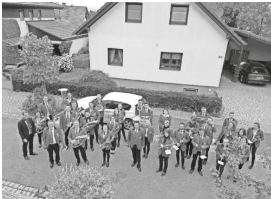
Der MVBD bei seiner Station im Ried

Da wir im letzten Jahr mehrere Stunden im Regen spielen mussten waren wir nicht verwöhnt und so konnte uns auch die Kälte in diesem Jahr am frühen Morgen nicht aufhalten. Es war richtig frisch als wir um 06:00 Uhr am Haus der Vereine starteten und wir waren sehr froh über die ersten Stationen bei denen wir uns aufwärmen konnten. Gegen 10.00 Uhr waren dann auch die ersten Sonnenstrahlen zu sehen und als wir gegen 13:00 Uhr auf dem Castell bei der Feuerwehr angekommen waren war es sogar richtig heiß. Ganz herzlichen bedanken wollen wir uns auch in diesem Jahr wieder bei allen Gastgebern. Es freut uns sehr, dass diese Tradition noch so lebendig ist.